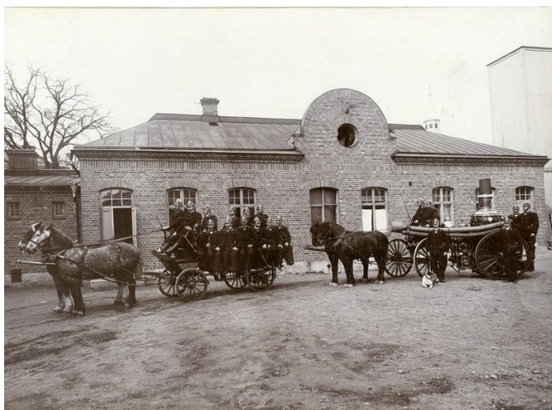
Den kombinerade polis- och brandkåren med hästarna Strix, Frej, Max och Balder samt hunden Osborn står uppställda på innergården i nuvarande kvarteret Igor, redo för utryckning! Runt år 1903.

Stadsarkivet ger onsdagen den 26 april tre föreläsningar med lokalhistorisk anknytning!